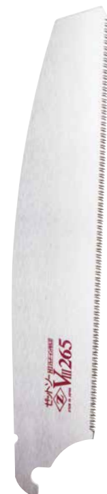
ゼットソー VIII265 替刃商品サイズ W66×H334mm