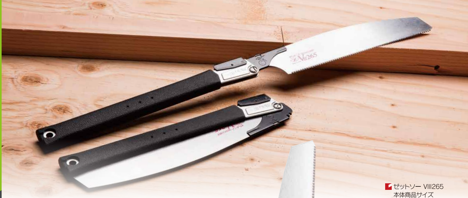
ゼットソー VIII265 本体商品サイズ W70×H645mm