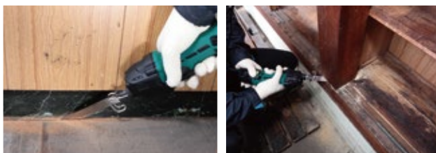
リフォーム時の丸ノコ刃がとどかない柱や梁の切断に。