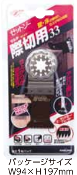
パッケージサイズ W94×H197mm