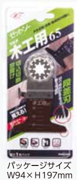
パッケージサイズ W94×H197mm