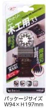
パッケージサイズ W94×H197mm